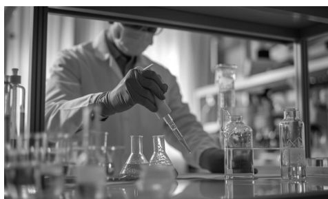
图 1-1 体力劳动和脑力劳动

体力劳动是脑力劳动的基础，脑力劳动支配体力劳动。体力劳动与脑力劳动不是同时出现的。在原始社会中，由于人类群体内部不能提供剩余产品，因此有劳动能力的人都要参加体力劳动，没有专门从事脑力劳动的人。随着生产力水平的提高，人类群体内部有了剩余产