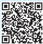
婴幼儿托育机构设置标准的要求

2019 年 10 月，国家卫生健康委根据《关于促进 3 岁以下婴幼儿照护服务发展的指导意见》，正式印发《托育机构设置标准（试行）》。该标准坚持“政策引导、普惠优先、安全健康、科学规范、属地管理、分类指导”的原则，为经有关部门登记、卫生健康部门备案，向 3 岁以下