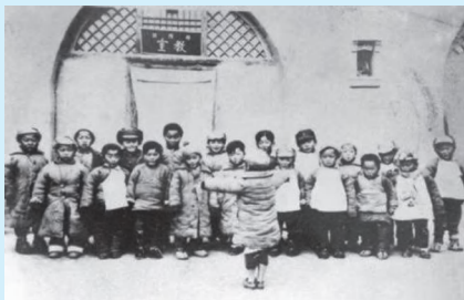
图3-1 陕甘宁边区儿童保育院的儿童

我国婴幼儿照护事业可以追溯到抗日战争时期。1938年，陕甘宁边区儿童保育院在延安正式成立，保育院收容了500多名儿童，其中有很多是烈士遗孤（图3-1）。党中央特别关注保育院工作，把儿童事业作为一项事关民族传承、国家发展、社会进步的战略任务传承至今。可以说，延安保育院奠定了中华人民共和国成立后婴幼儿托育和儿童教育的红色根基。