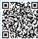
婴幼儿托育机构建筑环境的要求

托育机构的建设应当综合考虑城乡区域发展特点，将婴幼儿照护服务纳入经济社会发展规划，综合考虑经济社会发展水平和现有托育服务工作基础，以满足群众需求为导向，科学、合理地进行托育机构的建设规划。