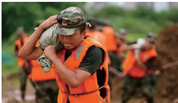
图 1-14 军队救灾（来源：人民网）

红军初创时期，我党就提出了工农武装离不开工农群众的思想，明确了“打仗、筹款子、做群众工作”三大任务，我军从一开始就同人民群众产生了水乳交融、生死与共的军民鱼水情。抗日战争和解放战争时期，我党提出了军民一致、军政一致、官兵一致的原则，发起拥政爱民活动。新中国成立后，我军继承和发扬密切联系群众的优良传统，自觉践行“全心全意为人民服务”的根本宗旨，始终和人民同呼吸、共命运、心连心，完全彻底地为人民而工作（图 1-14）。“最后一斗米送去做军粮，最后一尺布送去做军装，最后一件老棉袄盖在担架上，最后一个亲骨肉送去上战场。”这就是军民团结如一人的生动体现。陈毅元帅指出：“淮海战役的胜利，是老百姓用小车推出来的。”改革开放以来，人民群众致富不忘拥军、发展不忘国防，以各种方式支援军队建设，始终是人民军队发展壮大的坚实靠山。