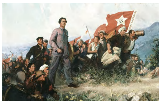
图 1-2 《南昌起义》 图 1-3 《秋收起义》

1927年12月11日爆发的广州起义，是中国共产党在大革命失败后带领工人和军队在城市举行武装起义夺取政权的一次大胆尝试。广州起义虽然失败了，但它证明了在半殖民地半封建社会的中国，首先夺取中心城市的道路是行不通的，党必须对革命道路展开新的探索。