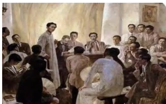
图 1-1 《八七会议》

大革命失败的惨痛教训，使中国共产党人认识到军队和武装斗争的极端重要性。1927年8月7日，中共中央在湖北汉口召开紧急会议（即八七会议，