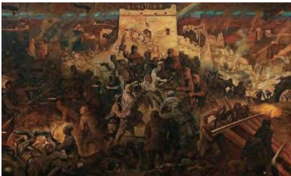
图 1-7 《百团大战》