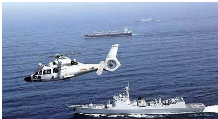
图1-10 中国海军护航编队在亚丁湾海域执行护航任务

海军是在陆军的基础上组建起来的。1949年4月23日，中国人民解放军华东军区海军在江苏泰州白马庙乡成立，张爱萍任司令员兼政治委员。这一天被定为海军成立日。1950年4月14日，海军领导机关在北京成立。1955年组建南海舰队，将华东军区海军改称东海舰队，1960年组建北海舰队，80年代组建海军陆战队，海军逐步发展成为一支由潜艇部队、水面舰艇部队、海军航空兵、海军岸防兵和海军陆战队的诸兵种合成军种。2013年5月10日，经中央军委批准，海军首支舰载航空兵部队在渤海湾正式成立。海军由近海防御型向远海护卫型转变，成为维护国家主权、捍卫海洋权益和海外利益、促进统一大业的重要力量（图1-10）。