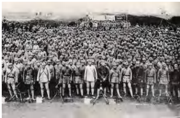
图 1-4 红军改编和开赴抗日前线誓师动员大会会场

级士兵委员会，实行民主制度，官兵在政治上、生活上一律平等。这些措施的实行，使旧军队的各种不良作风得以逐渐扭转，从组织上确立了党对军队的领导，这也是建设无产阶级领导的新型人民军队的重要开端。