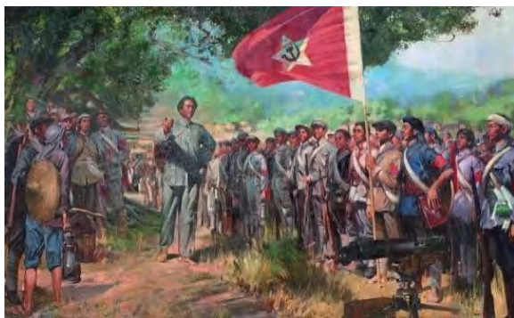
图 1-13 《三湾改编》

党对军队的绝对领导是我们党建军治军的伟大创举。党对军队绝对领导的根本原则和制度，发端于南昌起义，奠基于三湾改编（图 1-13），定型于古田会议，在抗日战争、解放战争中不断巩固完善，新中国成立后从建军根本原则上升为国家军事制度，改革开放后随着中国特色社会主义制度的发展而发展。党的十九大把党对人民军队的绝对领导作为新时代坚持和发展中国特色社会主义的一条基本方略并写入党章，这标志着我党对建军治军规律的认识达到了一个新的高度。