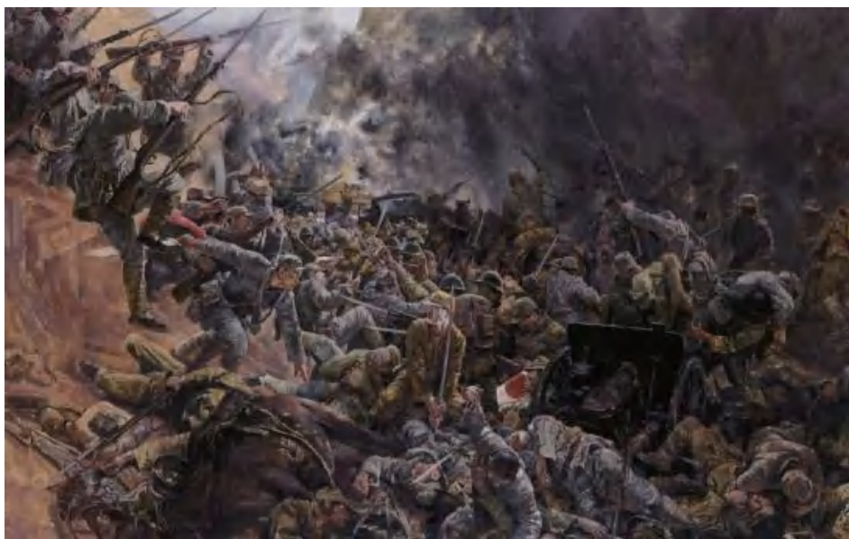
图 1-6 《平型关大捷》

1940年8月20日，八路军参战部队同时向日军发起猛烈攻击，实际参战兵力大大超出原来计划的参战兵力，达到约20万人，被称为“百团大战”（图1-7）。据八路军总部统计，参加百团大战的八路军共进行大小战斗1824次，击毙击伤日军20645人、伪军5155人，俘虏日军281人、伪军18407人，缴获枪械5942支（挺）、各种炮53门，破坏铁路474公里、公路1502公里、桥梁213座，拔除大量据点。八路军在此次战役中也付出重大代价，伤亡1.7万余人。百团大战是在世界反法西斯战争处于低潮、中国抗战面临困难、妥协投降氛围甚浓的形势下取得的胜利，它提高了中国共产党和八路军的威望，鼓舞了中国军民的抗战信心。