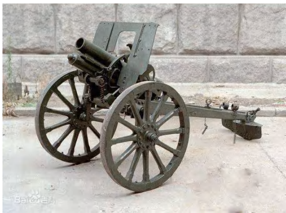
图 1-5 平型关战役缴获的日军九二式步兵炮

1937 年 9 月 25 日，第 115 师主力设伏于平型关东北至东河南镇长约 13 公里的公路两侧高地，对从灵丘向平型关方向进犯的日军第 5 师团第 21 旅团一部发动突然攻击，经整日激战，歼灭日军 1000 余人，击毁汽车 100 余辆、马车 200 余辆，缴获步枪 1000 余支、机枪 20 余挺，还缴获了日军九二式步兵炮 1 门（图 1-5）。平型关大捷（图 1-6）是卢沟桥事变以来，中国军队主动寻歼日军的第一个重大胜利，沉重打击了日军的嚣张气焰，粉碎了“日军不可战胜”的神话，极大地振奋了全国军民的抗日信心，提高了中国共产党和八路军的威望。