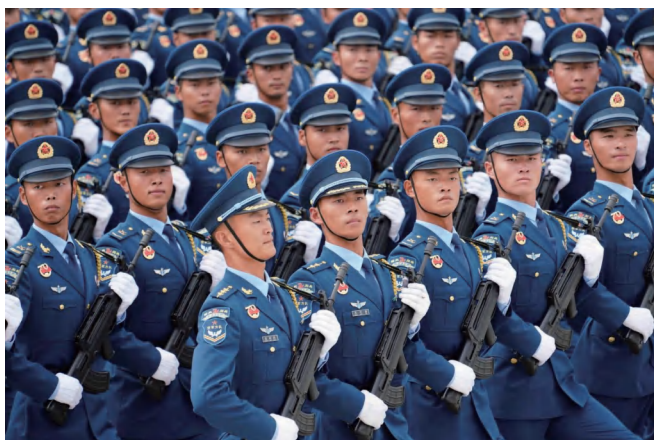
图 1-17 天安门阅兵步兵方队