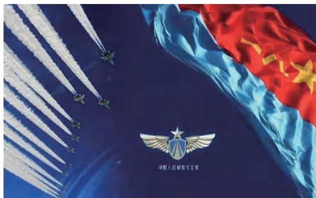
图 1-11 中国人民解放军空军标志

中央军委决定将空军与防空军合并为空军。经过七十多年的发展，空军由国土防空型向攻防兼备型转变，成为维护国家主权、保卫祖国领空、促进统一大业的重要力量（图 1-11）。