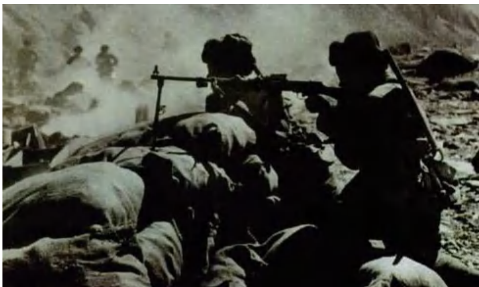
图 1-16 中印边境自卫反击战中的解放军

新中国成立后，中国人民志愿军与朝鲜人民并肩作战，打败了以美国为首的“联合国”军队。此外，中国人民解放军在1962年中印边境自卫反击战（图1-16）、1969年珍宝岛自卫反击战、1974年西沙海战、1979年对越自卫反击战和1988年南沙海战等作战中都取得了胜利，有力地捍卫了国家主权、领土完整，为国家的建设和发展提供了安全保障。