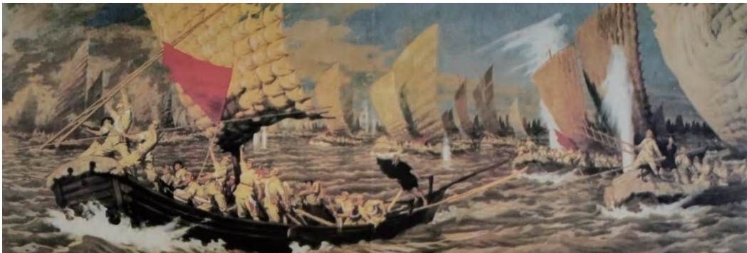
图 1-8 《百万雄师下江南》

解放战争时期，人民解放军共歼灭国民党军队 807 万人，解放了广大国土，为新中国诞生立下了不朽的历史功勋（图 1-8、图 1-9）。人民解放军在战斗中成长、在继承中创新、在建设中发展，在解放战争期间，总兵力发展到了 550 万人。