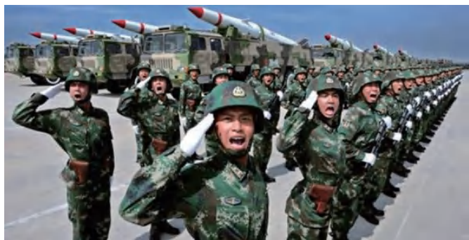
图 1-12 中国人民解放军火箭军

火箭军（图 1-12）的前身为第二炮兵，成立于 1966 年 7 月 1 日，由时任主席毛泽东批准、时任总理周恩来亲自命名，是中央军委直接指挥的战略部队，由核导弹部队、常规导弹部队，以及各种保障部队等组成，是我国实施战略威慑的核心力量，主要担负核威慑和核反击任务。