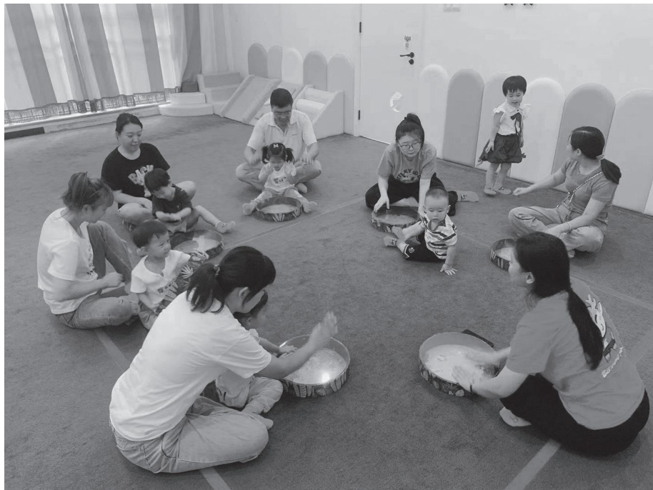
图1-4 “拨浪鼓咚咚响”亲子活动