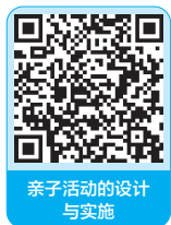
亲子活动的设计 与实施

亲子活动是家庭生活中不可或缺的一部分，它能够增强亲子关系，提升婴儿的情商和智商。我们在进行亲子活动时需要注意以下几点。