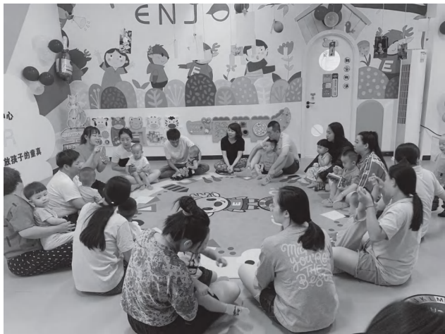
图1-5 亲子一同参加活动

(2) 亲子律动操。接待后，教师会组织家长和婴儿集中在一起进行几分钟的亲子律动操，在音乐的带动下，家长和婴儿与教师互动，跟着教师学做操，教师会针对家长和婴儿的情况和活动的要求进行口头指导。要想真正地让家长 and 婴儿参与进来，教师需要运用有效的组织策略。首先，对1岁以下的婴儿来说，参与这样的活动要求人数少（最多6个婴儿），婴儿情绪状态佳，教养者的操作令婴儿觉得舒适；对不愿意参与的婴儿应以家长学习为主，允许婴儿适度地从事其正在积极关注的活动。另外，如果参加亲子活动的家长是祖辈，教师要提供备用方案，可以让他们将活动内容记录，回家让父母和婴儿做，或请父母尽可能陪婴儿来参加活动（图1-5）。