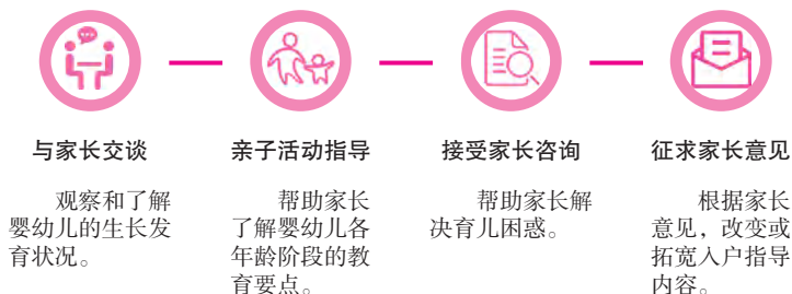
图 3-1 入户指导的四个步骤

保育人员根据预先制订的指导方案进行实际操作。整个入户指导过程一般分为四个步骤(图3-1),保育人员可根据现场情况灵活安排各个步骤。