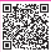
婴幼儿亲子交流与 玩耍要点