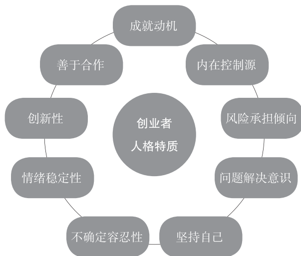
图 2-1 九种创业者人格特质