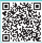
大学生创业技能量表

技能是指人们通过练习而获得的动作方式和动作系统。技能作为活动的方式, 有时表现为操作活动方式, 有时表现为心智活动方式。