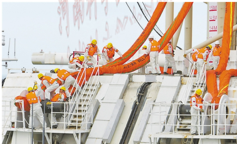
图1-2 劳动者之美：港珠澳大桥建设者梦之队

回望这项超级工程的建设之路，港珠澳大桥从最初酝酿建设到如今建成通车，历经了35年的岁月。从开工到通车历经9年，铸就总体跨度最长、钢结构桥体最长、海底沉管隧道最长、世界最长的跨海大桥。2000多个日日夜夜，2万多名来自全国各地的工程技术人员，投身于港珠澳大桥的建设。他们攻坚克难、不断创新，树立起了中国桥梁建设的新标杆。2018年10月23日上午，港珠澳大桥开通仪式在广东珠海举行，习近平总书记出席大桥的开通仪式并宣布港珠澳大桥正式开通。他盛赞港珠澳大桥“体现了一个国家逢山开路、遇水架桥的奋斗精神，体现了我国综合国力、自主创新能力，体现了勇创世界一流的民族志气”，会见了大桥管理和施工等方面的代表，并评价大桥建设者“功不可没、劳苦功高”。