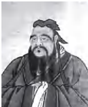
图 1-2 孔子

孔子(公元前 551—前 479)，名丘，字仲尼，春秋时期鲁国陬邑(今山东曲阜)人，儒家学派的创始人，中国古代伟大的思想家、教育家(图 1-2)。孔子出身于没落的贵族家庭，三岁丧父，其幼年生活贫寒，从小聪颖好学，在三十岁时开始创办私学，比较成功，吸引了众多的弟子前来求学，门徒日众，四十岁时创立儒家学派，大力宣传自己的思想，五十岁时出任鲁国的中都宰，后因与政权者意见不合而弃官，而后带领弟子进行游学，晚年授徒修书，对“六经”——《诗》《书》《礼》《易》《乐》《春秋》进行了整理与编订。