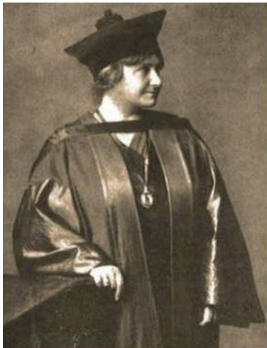
图 1-2 蒙台梭利博士毕业照

1904—1908年，蒙台梭利受聘在罗马大学教育学院开设大学本科课程，讲授教育人类学。蒙台梭利自己一直希望有机会把智力缺陷儿童教育的方法应用于正常儿童。她曾这样说：“从我最初