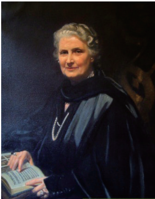
图 1-1 蒙台梭利肖像

蒙台梭利(图 1-1)是继福禄贝尔之后教育史上杰出的幼儿教育家。她一生致力于探索“科学教育”,创立了“儿童之家”,创造了独特的幼儿教育方式,并通过编写教育书籍和举办国际培训课程传播她的教育思想和方法,促进了现代教育的改革和发展。