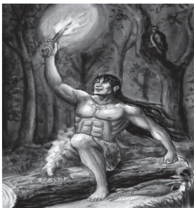
图 1-1 燧人氏钻木取火

原始社会的儿童共育，其教育内容是与儿童将要从事的社会生产和生活活动密切相关的。生产劳动教育是重要的儿童教育内容。由于当时生产力水平极为低下，每个有劳动能力的人都必须从事生产劳动，才能维持生存，每个儿童自幼年起就要向年长一代学习劳动技能。