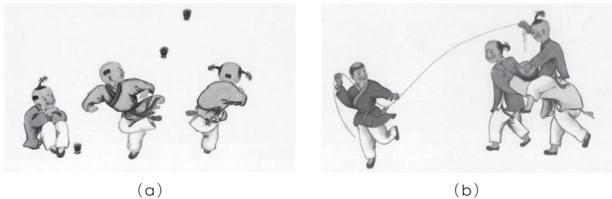
图 1-3 古代儿童游戏