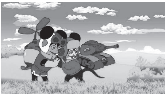
图1-3 《舒克和贝塔历险记》

郑渊洁的童话《皮皮鲁外传》，皮皮鲁坐着“二踢脚”上天空，还拨动控制地球转速大钟的指针，好让地球加快转动，结果地球上的一切都乱了套；《舒克和贝塔历险记》，两只可爱的小老鼠当上了勇敢的飞行员和坦克手。作者时而让空中的飞机和地面的坦克展开惊心动魄的大战，时而又让它们联合起来，通过无线电联络，共同行动，制服猫王国的国王——一只移植了老虎胆和人工心脏的小白鼠。