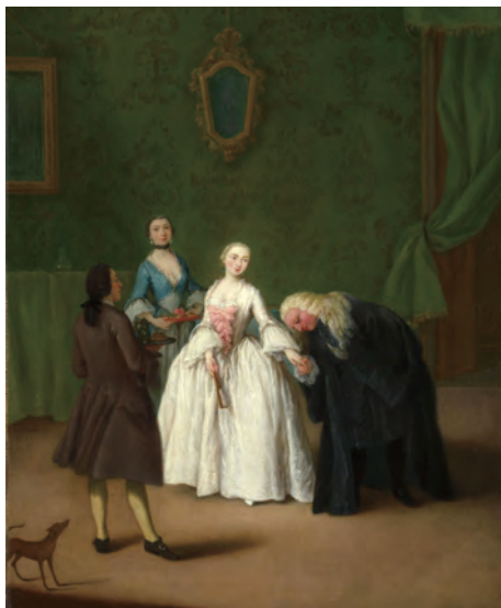
图 1-2 贵族礼仪

此时是欧洲封建社会的鼎盛时期。中世纪欧洲形成的封建等级制，以土地关系为纽带将封建主与附庸联系在一起。此间，他们制定了严格而烦琐的“上等人统治，下等人服从统治”的秩序，国王、贵族、骑士构成了上等统治者，形成了贵族礼仪（图 1-2）、宫廷礼仪。例如，于 12 世纪写定的冰岛诗集《埃达》，就详尽地叙述了当时用餐的规矩——佳宾贵宾居上座，举杯祝酒有讲究。贵族要接受包括礼仪内容在内的“骑士教育”，培养“骑士风度”，产生了深远影响，如沿革至今的“女士优先”的礼仪。