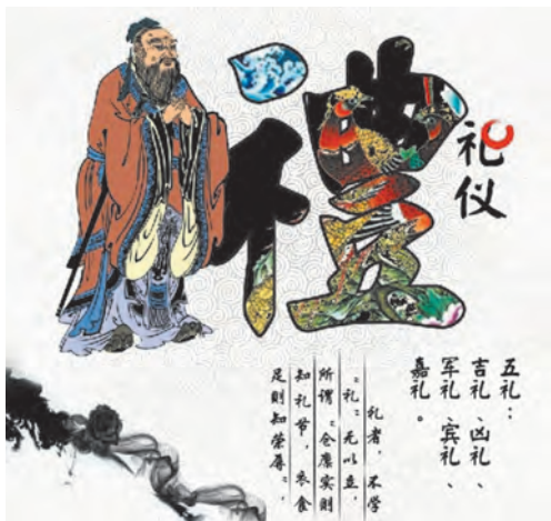
图 1-1 西周五礼

礼仪最早是从祭拜神灵开始的。原始社会生产力水平十分低下，人们处于愚昧无知的状态，对很多自然现象无法解释，认为有一种超自然的力量在主宰着人类，于是产生了对神灵的崇拜和祭祀。