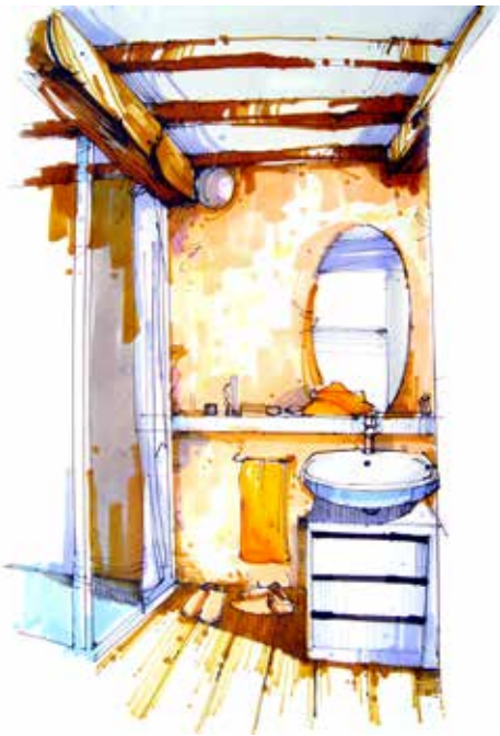
图 2-1-10 某卫生间细部表现图 / 李鹏设计 / 中国 / 2010 年

图纸的制作有手绘、机绘和二者结合的方式。手绘可运用针管笔、马克笔、彩铅、尺规等绘图工具进行平面图、立面图、效果图及其他分析图的绘制。其特点是具有较强的艺术表现力。特别是方案初期阶段，手绘草图更方便快捷，便于及时与甲方的沟通(图 2-1-10、图 2-1-11)。机绘是在电脑上运用各种绘图软件(如 AutoCAD、PhotoShop、3DMax、SketchUp 等)进行辅助设计和表现。电脑绘图特别是对一些矢量软件的运用使得软装饰设计的各类图纸的后期制作更加精确、逼真。手绘与机绘结合的表现方式则兼有二者的优势。