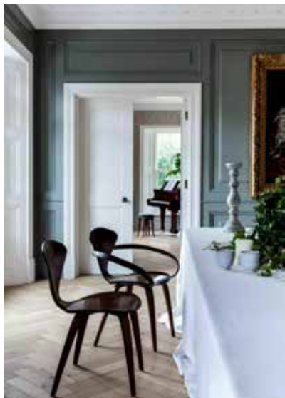
图 1-14 影响精神环境的软装饰 /Blaze Makoid/ 英国 /2012 年