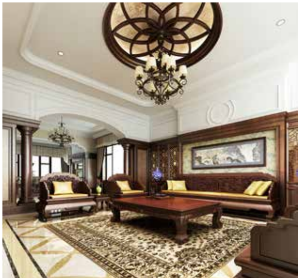
图 2-1-13 电脑效果图 2 / 唐建筑设计 / 中国 / 2016 年