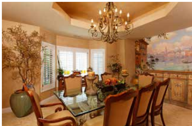
图 1-1-13 软装饰可以节约成本

综上，软装饰设计作为环境设计的子系统，作用与意义显而易见。第一，其首要作用是装饰和美化空间。软装饰设计是在室内外环境的基础建设完成之后，设计师通过对软装饰品的设计、选择、排列、组合、摆放，来调节和增强整体空间氛围，它在氛围的营造、空间的柔化、色彩环境的调节以及空间层次的加强或划分等方面有着相当重要的作用。