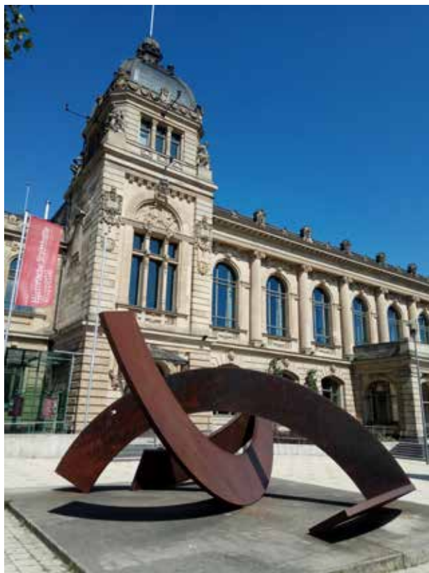
图 1-1-18 德国伍伯塔尔街头的抽象艺术

当下, 根据室内外使用功能的不同, 软装饰设计可大体分为居住空间软装饰设计、公共空间软装饰设计与园林景观软装饰设计三类。居住空间软装饰设计主要是根据居住者的自身条件及精神需求, 为家庭营造出温馨的室内环境(图 1-1-19)。公共空间软装饰设计是指除了住宅以外的所有建筑物的室内空间, 根据环境及使用性质的不同, 创造出独特的空间氛围(图 1-1-20)。园林景观软装饰设计主要面向的是室外环境, 旨在为户外塑造一个生动活泼、引人入胜的景观效果(图 1-1-21)。但无论是那一类的软装饰设计都是自然环境的组成部分, 因此, 居住空间、公共空间、园林景观和软装饰就形成了不可分割的完整系统, 都是为人们提供舒适、安全、休闲、愉快的城市生活环境。