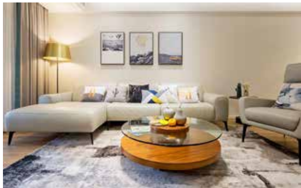
图 1-1-4 现代风格装修效果图 / 昊然设计 / 中国 /2016 年