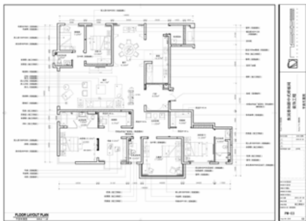
图 2-1-7 平面布置图 / 几何空间设计 / 中国 / 2015 年