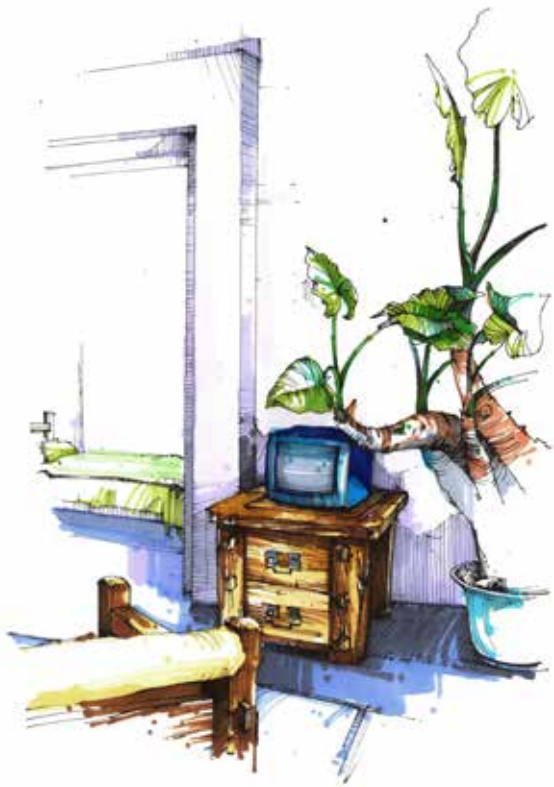
图 2-1-11 某客厅细部表现图 / 李鹏设计 / 中国 / 2010 年

图文并茂是设计成果最常见的表达方式。文字说明首先要求语言规范准确，字词句不应产生歧义误解；其次要求语言条理清晰、简明扼要，避免逻辑混乱、冗长堆砌。好的文字说明是对图纸的必要补充，使图文相互支撑、相互辉映。通过文字，设计师可以对设计背景、设计构思创意、设计特点等设计理念进行准确无误、言简意赅的阐述。