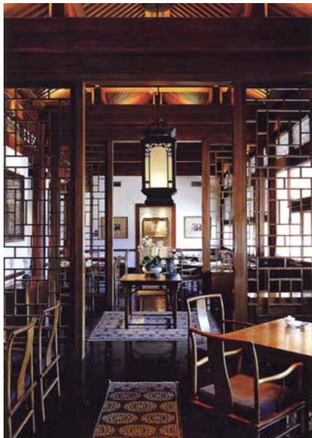
图 1-1-20 JAYA 酒店茶室软装饰 / 选自马蹄室内设计网