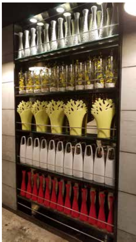
图 1-1-5 某餐厅室内陈设