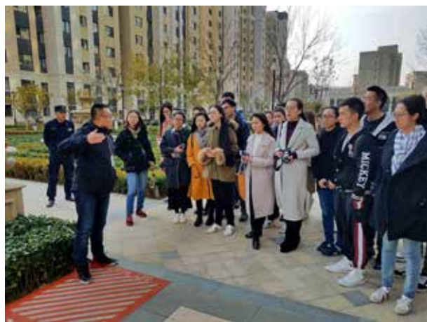
图 2-1-1 施工现场调研

明确了任务书的各项内容之后，为更加明晰设计任务，顺利开展下一步的设计工作，就应该着手进行项目调研，到现场拍摄照片，对场地环境进行观察，收集与设计有关的资料，补充并完善任务书和设计委托方提供资料不完整的内容，对整个项目现状进行综合分析（图 2-1-1）。收集来的资料和分析的结果应尽量用图面、表格或图解的方式表示。