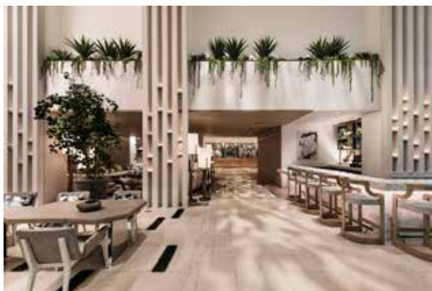
图 1-1-8 整体环境下的软装饰效果