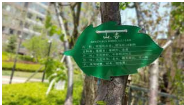
图 1-1-17 具有教育作用的树牌 / 作者自摄

(1) 纯观赏性的软装饰。如艺术品、工艺品、纪念品、观赏性动、植物等。纯观赏性的软装饰仅作为观赏用，不具备使用功能，它们或具有明显的装饰效果，或具有浓厚的艺术特质，或具有文化和历史的人文气息。