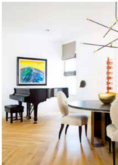
图 1-1-16 北欧风格软装饰设计 /Blaze Makoid/ 英国 /2012 年

为软装设计的最大优势，因为它更方便了设计随着时间或者理念的变化而更新换代的便捷性。第二，软装饰空间的多维性。不论空间环境的大小、性质如何，只要对空间的设计有丰富的需求就少不了软装饰设计，因此软装饰环境具有非常强的多维性，如不同类型的家居空间、酒店空间（图 1-1-15）、主题酒吧空间、景观园林、展示中心等。第三，复杂多样性。软装饰的复杂多样性体现在很多方面，它是由多维装饰空间的自然属性所导致。比如，热带地区室内的软装饰多色彩鲜明且空间通透，因为当地的人们要通过大量植物及鲜明的色彩显示环境的热辣及民族的豪放；而寒带地区如北欧国家的室内装饰物多颜色偏暖，或多使用自然材质，以此来弥补对温暖的心理需求（图 1-1-16）。除此之外，不同的材质、造型、色彩等都会导致软装饰的多样性，且随着社会的发展、设计的提高，软装饰的类型及品种定会更丰富多彩。具体到软装饰元素表现的不同作用形式，可将其分为以下四大类型。