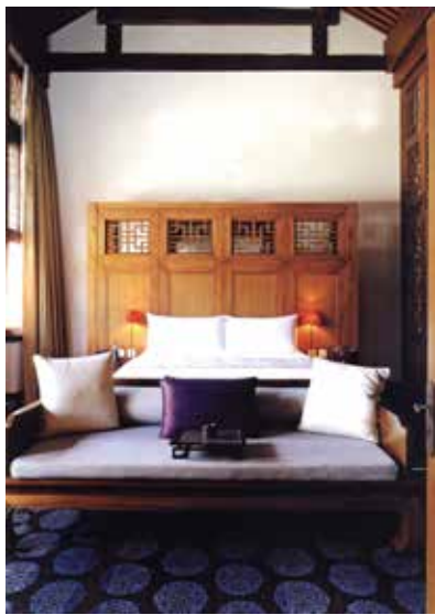
图 1-1-15 JAYA 酒店软装饰