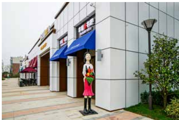
图 1-1-6 装饰性陈设 / 迪东设计 / 中国 / 2016 年

陈设分为功能性陈设和装饰性陈设两类。功能性陈设也可称为“实用性陈设”，这类陈设物品具有实用性，可以满足室内使用功能，如家具、容器等。实用性陈设物品的存在，客观上美化了室内环境，丰富了室内空间层次，调节了空间节奏，创造了一种合理、舒适、优美的生活环境，极大地满足了人们使用的要求。装饰性陈设是以观赏为主要目的，陈设品本身也有使用价值，但更重要的是其具