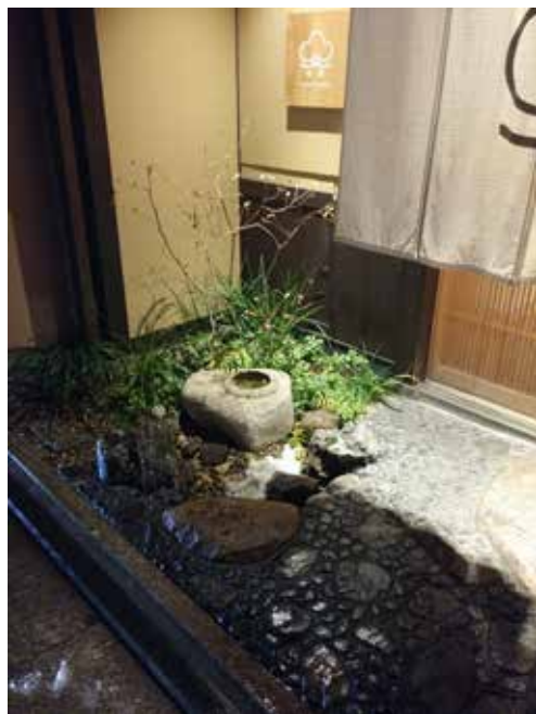
图 1-1-10 日式装饰小品

在环境设计中，就室内领域而言，地板、顶棚、墙面、瓷砖、门窗等在完成安装之后，都不能轻易地移动、改造；而床上用品、照明设施、窗帘以及各种艺术陈设品等，方便移动、更换，易于清洁，其属于软装饰（图 1-1-9）。在室外环境中，如园林景观中，园路铺装、园林构筑物、喷水池等需要提前建设完成，不能随意改动、重建；而各种可装配的和可移动的，供休息、装饰、照明、展示，以及供园林管理及方便游人之用的装饰设施，如园林桌椅、饮水泉、洗手池、公用电话亭、时钟塔、花钵、照明灯具等艺术装饰品，属于园林景观的软装饰（图 1-1-10、图 1-1-11）。