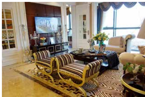
图 2-1-16 软装饰实施效果 / 唐建设计 / 中国 / 2016 年

在现场装配结束时，设计师会同业主及监理单位进行工程质检和验收。如发现装配不到位的地方，应及时返工或修补，为业主做出详尽说明。作为一名成功的软装饰设计师，要具备综合性的设计经验，对于各项实施工艺要有全面的认知。此外，一些奇特的设计造型处理方面对于施工人员也是一个考验，需要工人们认真对待，精雕细琢。所以，在此过程，更加需要设计师与工人的良好沟通与协商，这样才能打造出一件优秀的设计作品（图 2-1-16）。