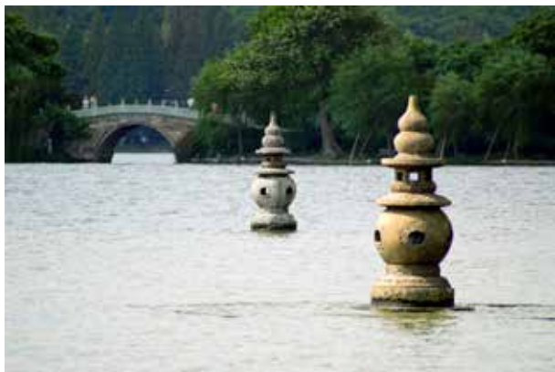
图 1-1-12 三潭印月