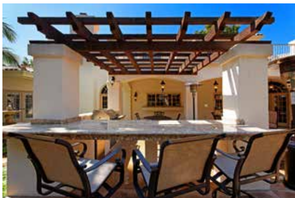
图 1-1-11 庭院桌椅

在环境设计中，就室内领域而言，地板、顶棚、墙面、瓷砖、门窗等在完成安装之后，都不能轻易地移动、改造；而床上用品、照明设施、窗帘以及各种艺术陈设品等，方便移动、更换，易于清洁，其属于软装饰（图 1-1-9）。在室外环境中，如园林景观中，园路铺装、园林构筑物、喷水池等需要提前建设完成，不能随意改动、重建；而各种可装配的和可移动的，供休息、装饰、照明、展示，以及供园林管理及方便游人之用的装饰设施，如园林桌椅、饮水泉、洗手池、公用电话亭、时钟塔、花钵、照明灯具等艺术装饰品，属于园林景观的软装饰（图 1-1-10、图 1-1-11）。