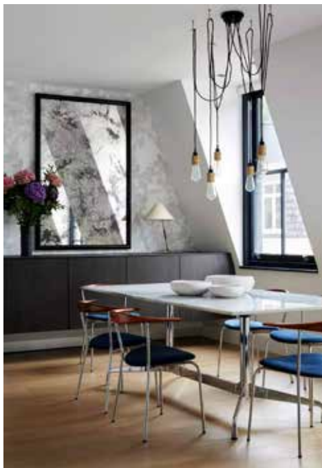
图 1-1-3 书房装修效果图 /Blaze Makoid/ 英国 /2012 年

装修和装饰不同，装饰是对生活用品或生活环境进行艺术加工的手法，能加强审美效果，并提高其功能、经济价值和社会效益。装修与客体的功能紧密结合，适应制作工艺，发挥物质材料的性能，并具有良好的艺术效果。设计师要基于一定的设计理念并依据一定的审美规则给出一套施工和设计方案，房间的配饰、灯具的定制、家具的摆放、门的朝向都在室内装修的范围内（图 1-1-4）。室内装修要达到的目的是：第一，对土建工程进行细节上的完善，弥补之前设计中的不足，并以方便居住生活为原则，对空间进行合理的分布、对环境进行合理的设计与安排；第二，根据审美的一般要求，给家居环境增添一定的美观性和舒适性。第三，要能够根据家居使用者的要求，设计出与家庭结构，以及家庭成员的身份、阅历相符的装饰风格，突出个性。