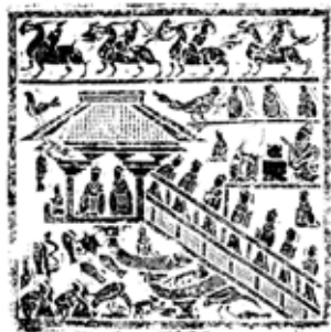
图 1-1-1 东汉画像石 / 选自《中国建筑史》

但很少是作为纯粹的装饰，大多带有宗教、迷信或巫术的含义。经历数千年发展，明清时代的环境装饰已经发展到相当精细和华丽的程度，达到了封建社会装饰艺术的顶峰。到了近现代，随着科学技术的发展，空间环境装饰的形式和内容更加丰富多彩，特别是西方设计风格的传入，使人们对于空间装饰形态，有了更多的选择（图 1-1-2）。现代意义上的装饰，是对生活用品或生活环境进行艺术加工的手法。英国设计史学家乔治·塞维奇认为，装饰设计是“建筑内部固定的表面装饰和可移动的布置所共同创造的整体结果”。装饰必须与所装饰的客体有机地结合，成为统一、和谐的整体，以便丰富艺术形象，增加艺术表现力，加强审美效果，并提高其功能、经济价值和社会效益。