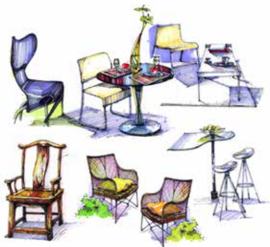
图 2-1-3 软装饰素材汇总分析 / 李鹏设计 / 中国 / 2010 年

简而言之，软装饰概念设计即是利用设计概念并以其为主线贯穿全部设计过程的设计方法。概念设计是完整而全面的设计过程，它通过设计概念将设计者繁复的感性和瞬间思维上升到统一的理性思维从而完成整个设计（图 2-1-4、图 2-1-5）。