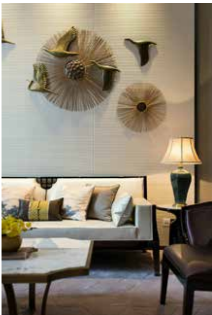
图 1-1-7 墙面软装饰设计 / 奥迅设计 / 中国 / 2016 年