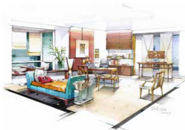
图 2-1-6 软装饰元素组织方案 / 沙沛设计 / 中国 / 2002 年

将各形式要素按一定规律组织起来(图 2-1-6)。这里的形式要素是指软装饰元素的造型、材料、色彩、质感、肌理、光影等;这里的规律既涉及科学,如“人体工程学”“环境心理学”等,又遵循一定的形式美法则,如“多样与统一”“整齐与参差”“对比与和谐”“对称与均衡”“比例与尺度”“节奏与韵律”等。除了软装饰形式要素的造型、色彩、材料(包括材料表现出的形态、光泽、色彩、质感等),现代软装装饰设计中还可考虑光影、声响等其他元素的运用。总之,扩充设计阶段是设计师运用专业知识将“设计意念”转化为“设计语言”的过程(图 2-1-7、图 2-1-8)。