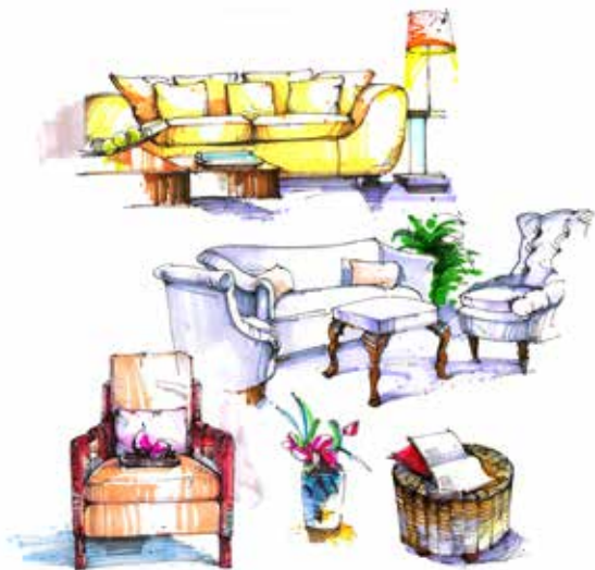
图 2-1-4 家具元素表现 / 李鹏设计 / 中国 / 2010 年