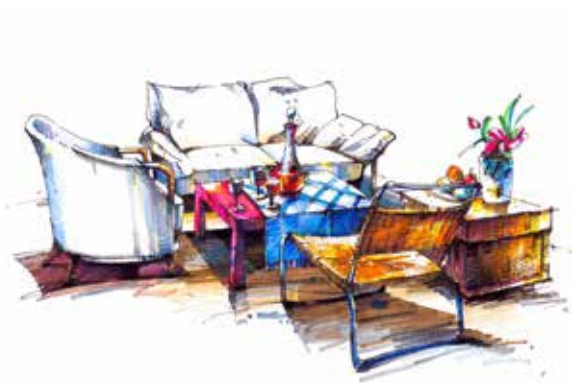
图 2-1-5 陈设元素表现 / 李鹏设计 / 中国 / 2010 年

简而言之，软装饰概念设计即是利用设计概念并以其为主线贯穿全部设计过程的设计方法。概念设计是完整而全面的设计过程，它通过设计概念将设计者繁复的感性和瞬间思维上升到统一的理性思维从而完成整个设计（图 2-1-4、图 2-1-5）。