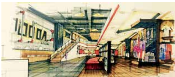
图 2-1-9 最终整体表现图 / 陈鹤设计 / 中国 / 2015 年

方案扩充设计任务完成后,经过委托方的评审和沟通,对方案扩充设计的内容进行反复修改完善,同时注重细节推敲,使扩充阶段的方案图纸应该具备可以使用该图纸进行施工图设计的要求。一些比较重要的项目,会在这一阶段召开扩充设计评审会。会上,专家们会比较集中而有针对性地提出相关问题。设计负责人需要充分说明设计理由,争取得到专家评委们的理解。在评审会上,如条件允许,设计方应尽可能运用多媒体电脑技术进行讲解,这样能使整个方案的设计理念和精细的局部设计效果完美结合,使设计方案更具有形象性和表现力。一般情况下,评审会后,总体设计思路和具体设计内容都能顺利通过评审,这就为成果表达打下了良好的基础。总的来说,扩充设计越详细,后续设计工作越省力(图 2-1-9)。