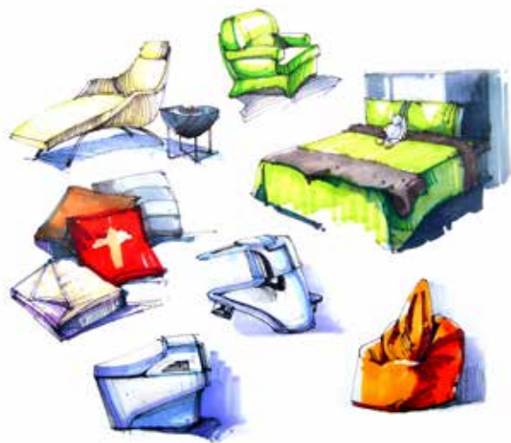
图 2-1-2 软装饰元素构成分析 / 李鹏设计 / 中国 / 2010 年