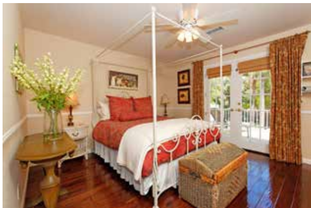
图 1-1-9 室内软装饰