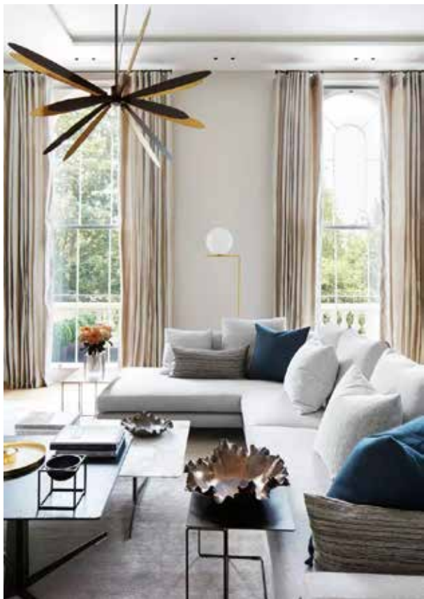
图 1-1-19 温馨的室内环境 /Blaze Makoid/ 英国 /2012 年