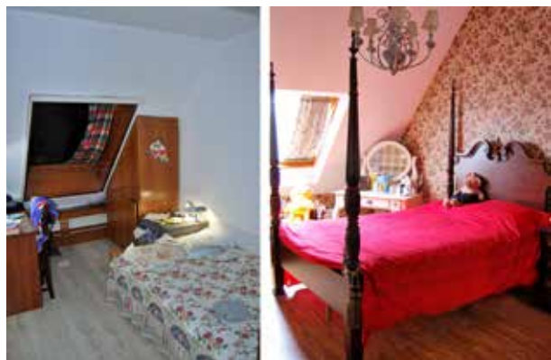
图 2-1-15 卧室软装饰改造前后对比

在整个设计实施期间，需要设计师到现场指导，按图纸的要求核对工人装配的情况，有时还要根据装配现场对图纸提出补充或局部修改建议，以尽快解决现场遇到的各种问题，特别是对工人装配工艺的指导。一般会按照软装家具—布艺—画品—绿植—饰品等的顺序进行安装摆放。此外，作为合格的软装饰设计师，现场实际应变能力同样重要，有时要根据实际情况灵活处理设计变更（业主变更、现场情况变更等），对突发状况能够做到及时应对，保证整体的装配质量和工期（图 2-1-15）。