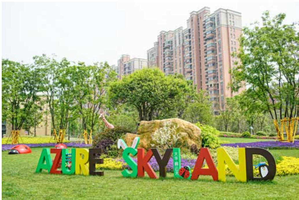
图 1-1-21 园林软装饰 / 迪东设计 / 中国 /2016 年