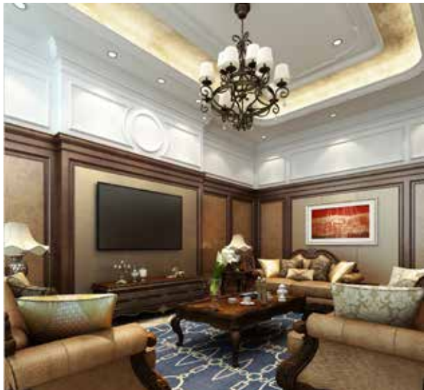
图 2-1-12 电脑效果图 1 / 唐建筑设计 / 中国 / 2016 年

局部软装饰效果图若干、软装饰元素组织图、节点大样图、软装饰元素意向图等(图 2-1-12、图 2-1-13)。设计成果(施工图)具有图纸齐全、表达准确、要求具体的特点,是进行设计实施、编制工程预算和设计实施的依据,也是进行技术管理的重要技术文件。