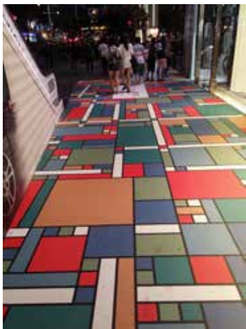
图 1-1-2 抽象风格的地面软装饰